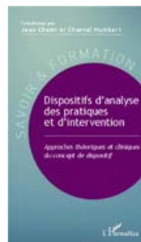
Dispositifs d'analyse des pratiques et d'intervention. Approches théoriques et cliniques du concept de dispositif.