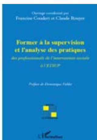
Former à la supervision et l'analyse des pratiques des professionnels de l'intervention sociale à l'ETSUP.

Nos formateurs permanents ou vacataires sont des professionnels expérimentés et qualifiés. Ils publient régulièrement des articles ou des ouvrages. Un ouvrage collectif publié en 2012, témoigne du travail d'accompagnement engagé par les formateurs.